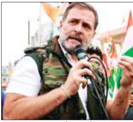
कांग्रेस नेता राहुल गांधी अग्निवीर योजना पर सवाल उठाते हुए।